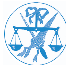
Il vecchio stemma

Ecco l'attuale stemma del Comune di Bione, dopo il riconoscimento ufficiale ottenuto con decreto presidenziale l'8 giugno 2007 .